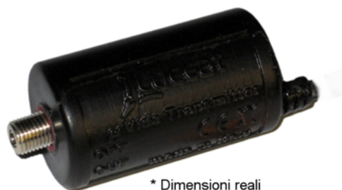
* Dimensioni reali